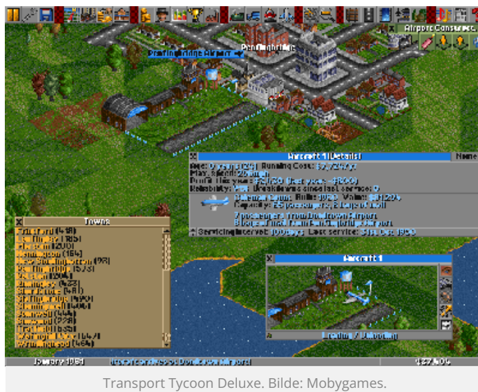
Transport Tycoon Deluxe.

I november 2024 kjøpte Atari hele Transport Tycoon-serien fra soloutvikleren Chris Sawyer . Den gangen sa de at de både hadde nye planer for serien og at de ville jobbe for å gjøre det originale spillet mer tilgjengelig. Nå har de gjort noe med det siste punktet, ettersom de har relansert Transport Tycoon Deluxe på Steam og GOG .